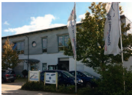
Blick auf das Multi-Components-Domizil in Schwabach.

Multi-Components steht – wie auch seine Lieferanten – auf einer soliden finanziellen Basis. Selbst 2009 konnte man so gut überstehen, dass Nebengebäude aquiriert werden konnten. Und auch beim Personal wurde aufgestockt. Mit den Flaggschiffen Samsung im Bereich SMD-Bestückung und TRI als Technologie-Lieferant für SPI, AOI, AXI und elektrischen Test sowie dem global agierenden Reflowlötssystem-Hersteller Heller ist man im SMT-Core-Geschäft bestens gerüstet.